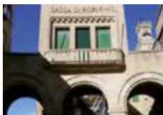
GALLERIA CASSA DI RISPARMIO Piazzetta del Titano San Marino