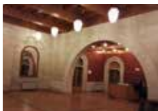
RIDOTTO TEATRO TITANO P.le lo Stradone San Marino