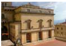
TEATRO TITANO Piazza Sant'Agata, 5 San Marino