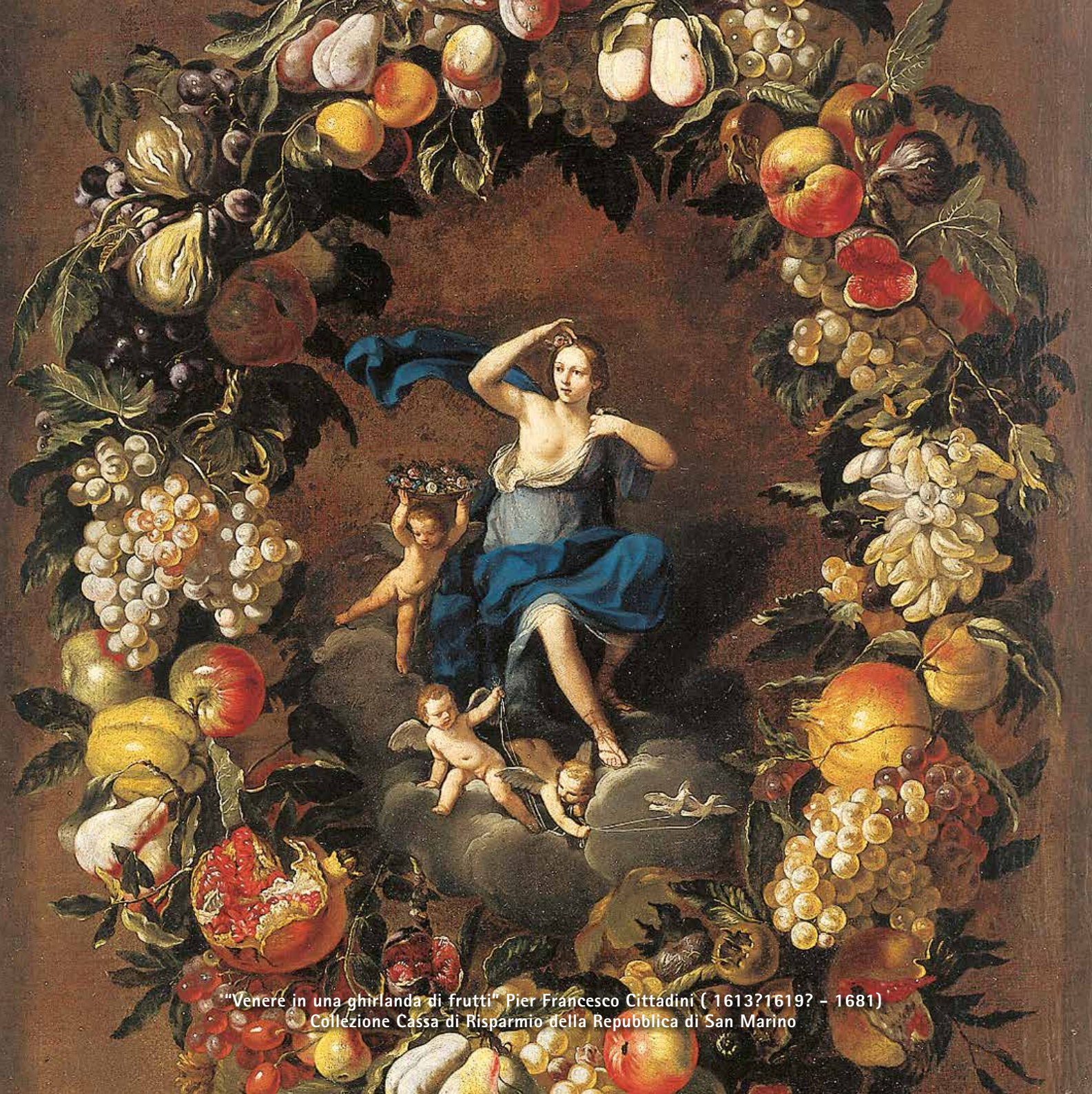
"Venere in una ghirlanda di frutti" Pier Francesco Cittadini ( 1613?1619? - 1681) Collezione Cassa di Risparmio della Repubblica di San Marino