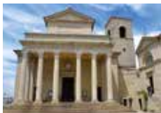
BASILICA DI SAN MARINO P.le Domus Plebis San Marino